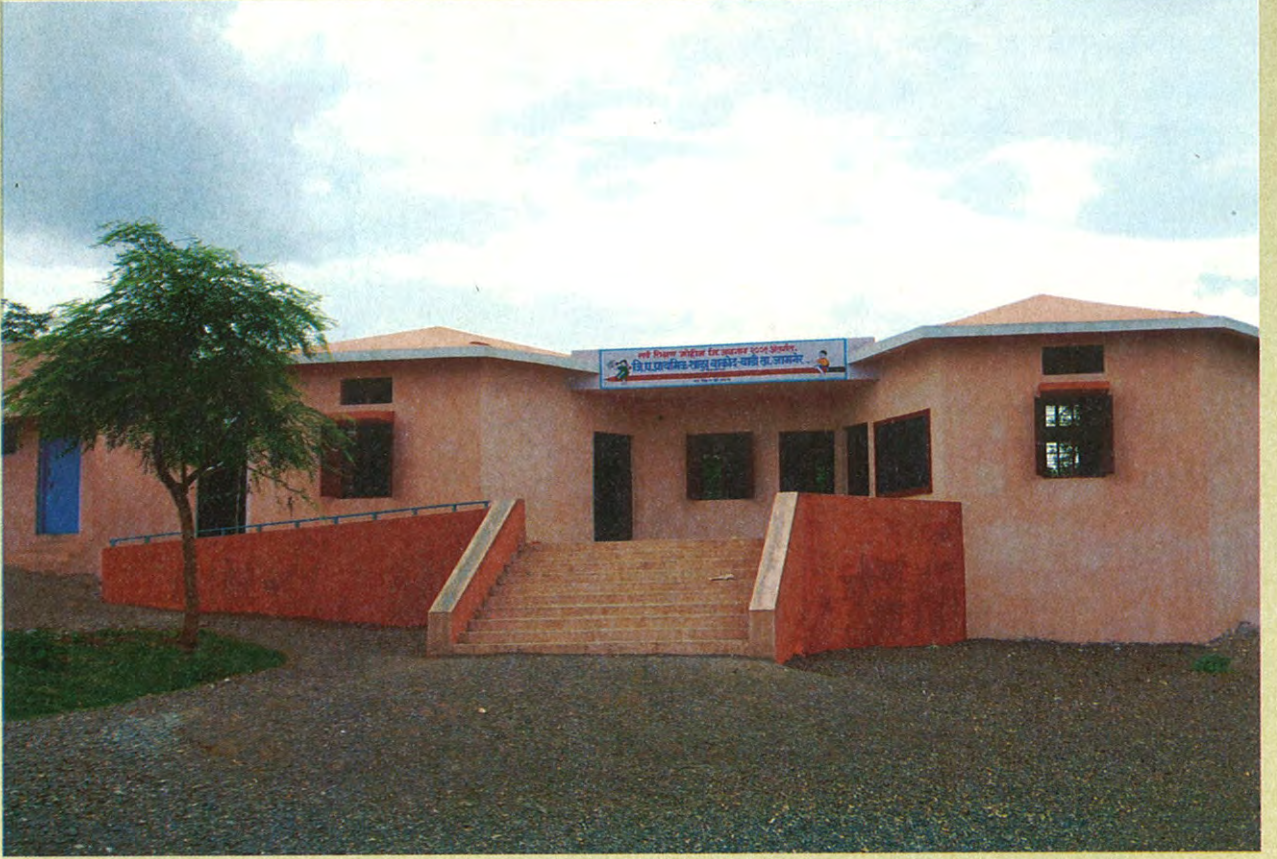
जिल्हा परिषदेची शाळा

आली. सरपंचपद महिलेसाठी राखीव असल्यामुळे ग्रामस्थांनी १५ च्या १५ जागांवर महिलांना बिनविरोध निवडून द्यावे, असा प्रस्ताव मोठ्या भाऊंनी ग्रामसभेत मांडला. १५ जागांसाठी ३३ नावे समोर आली. नंतर ग्रामस्थांनी एकोप्याने १८ नावे मागे घेतली. निवडणूक बिनविरोध होणार असे वाटत असताना गावातील काही मंडळींनी शब्द फिरवला आणि निवडणूक झाली; तरीसुद्धा ग्रामस्थांनी ९ महिलांना बहुमत दिले. काहीअंशी का असेना मोठ्या भाऊंची महिला राजची संकल्पना पूर्ण झाली.