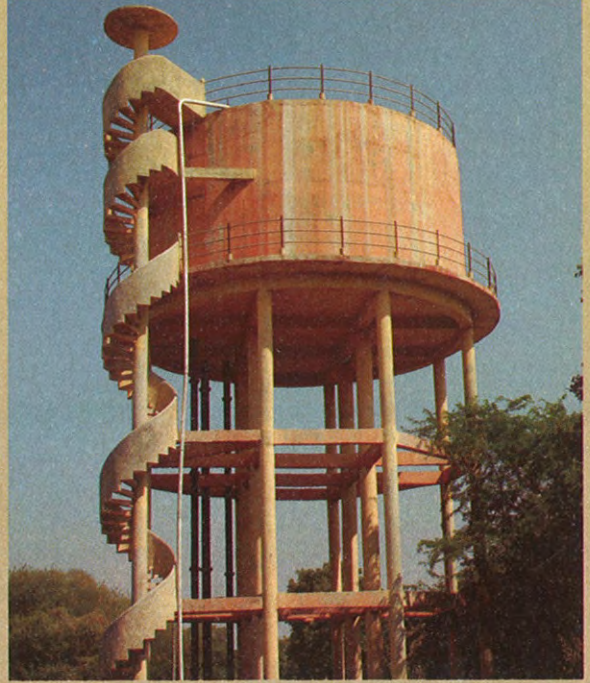
वोकोदमधील पाण्याची टाकी