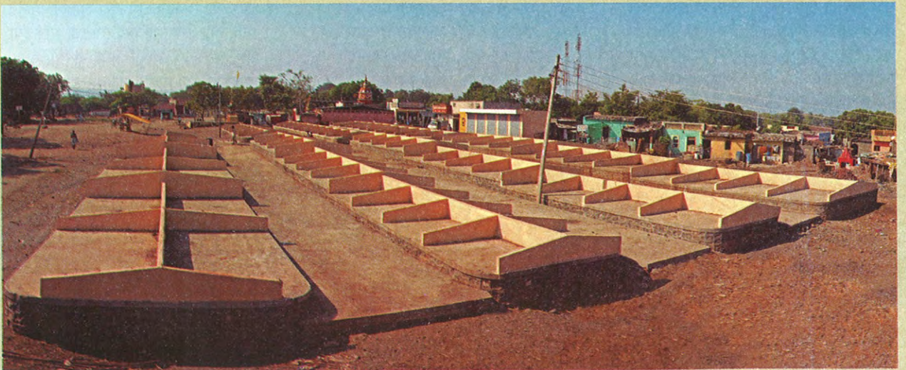
वोकोदमधील बाजार ओटे